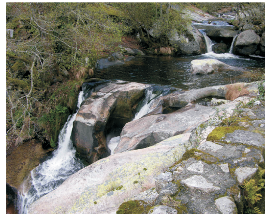
Poza na parte alta da ferveza